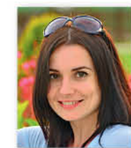
Автор проекта: Александра Горбачёва, ландшафтный архитектор

Осень раскрасила сад яркими красками. Зеленая палитра лета уступила место золоту и охре, рубиновым гроздьям рябины и багрянцу листвы кленов.