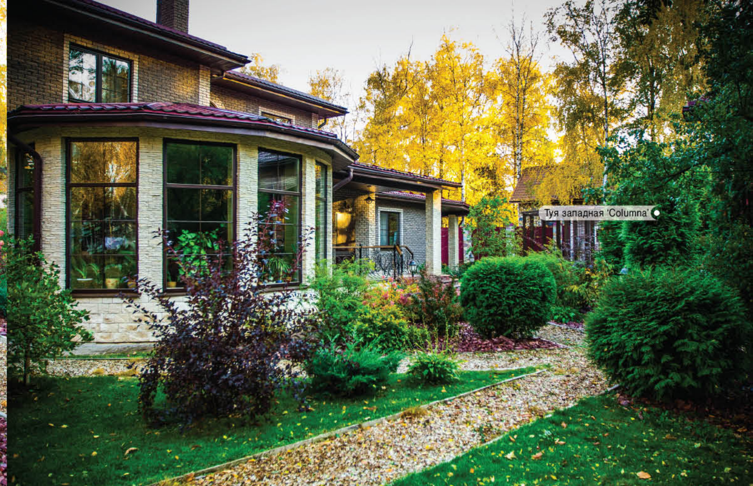
Туя западная 'Columna'