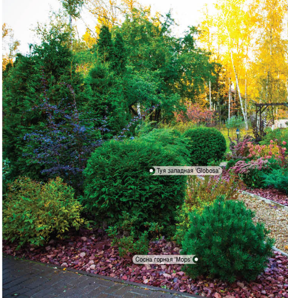
Туя западная 'Globosa'

Участок, на котором разбит сад, расположен в березовой роще. Основу осенней картины составляют желтый и золотистый цвета. Новые краски в палитру сада добавили с помощью деревьев, кустарников, травянистых многолетников. Красные всполохи дают клен красный и бересклет крылатый 'Complanatus' . Крупными розовыми соцветиями украшает сад гортензия метельчатая 'Pink Diamond' . Сорта пузыреплодника калинолистного 'Red Baron' и 'Diabolo' вносят нотку глубокого бордового. Розовых и малиновых оттенков добавляют плотные кустики очитка видного.